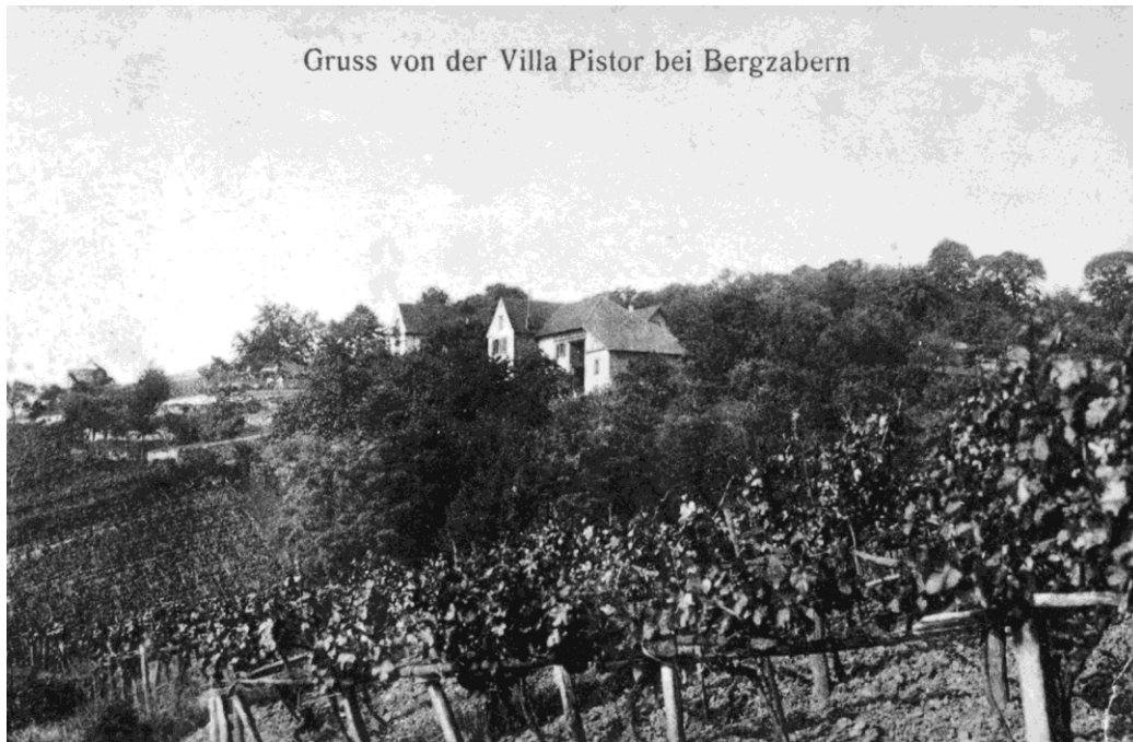
Gruss von der Villa Pistor bei Bergzabern